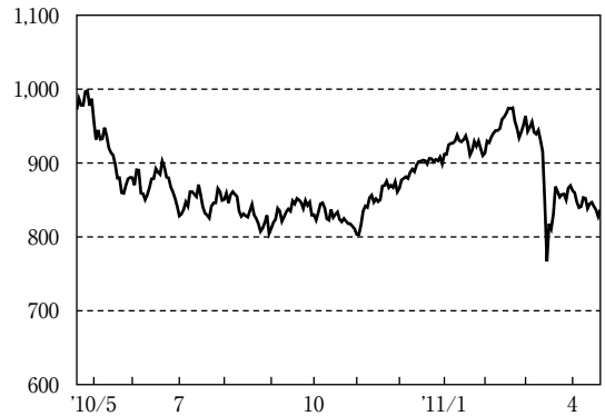
東証株価指数の推移

期首972.11のTOPIXは、日米金融当局による金融緩和策の継続姿勢などを支援材料に上昇基調で始まりました。しかし2010年5月に入ると、ギリシャなど一部欧州諸国の債務危機に対する不安が深刻化し、世界的な株安の様相となるなか急反落しました。その後、欧州連合(EU)などが財政問題への包括的な対応策を発表したものの、欧州での財政・金融不安はくすぶり続け、その影響から為替市場で急激な円高/ユーロ安が進行し、輸出関連株を中心にTOPIXは引き続き調整しました。6月以降は、国内主要企業の業績改善期待などが相場を下支えするものの、米国で発表された経済指標に軟調な内容となるものが相つぎ、世界的な景気減速に対する懸念が強まるなか、TOPIXは8月下旬にかけて一段と水準を切り下げました。9月上旬以降は、日銀の追加金融緩和への期待からTOPIXは一時持ち直しましたが、為替市場全般での円高進行が嫌気され、再び下値を模索する展開となりました。しかし11月に入ると、為替市場での円高基調の一服に加え、米国政府の大型減税の延長や日米での追加金融緩和などの景気刺激策を受けて国内株式の出遅れ感に着目した海外投資家の買いも膨らみ、TOPIXは大きく値を戻しました。2011年に入っても、中国が金融引き締め姿勢を強めたことや中東・北アフリカの政情不安を受けた原油価格の高騰などが相場の重しとなりましたが、米国での経済指標の改善に加え、日米主要企業の業績改善傾向から景気回復への期待が高まり、TOPIXは上昇幅を拡大しました。3月中旬には、東北地方太平洋沖地震の発生やそれに伴う原子力発電所の事故に加え、円が対アメリカドルで大幅に上昇したことなどから、TOPIXは急落しました。しかしその後、主要国が円売り協調介入を実施し円高への懸念が和らいだことから、海外投資家を中心に割安感が強まった銘柄を買い戻す動きが広がりTOPIXはやや持ち直しました。期末にかけては、大震災や原子力発電所の事故による経済への影響を見極めたいとの買い控えムードから上値は重く、837.17で期末を迎えました。