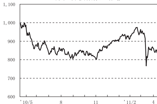
東証株価指数の推移

期首998.90のT O P I Xは、2010年5月に入ると、ギリシャなど一部欧州諸国の債務危機に対する不安が深刻化し、世界的な株安の様相となるなか下落基調で推移しました。その後、欧州連合(E U)などが財政問題への包括的な対応策を発表したものの、欧州での財政・金融不安はくすぶり続け、その影響から為替市場で急激な円高/ユーロ安が進行し、輸出関連株を中心にT O P I Xは引き続き調整しました。6月以降は、米国で発表された経済指標に軟調な内容となるものが相つぎ、世界的な景気減速に対する懸念が強まるなか、T O P I Xは8月下旬にかけて、一段と水準を切り下げました。9月上旬以降は、日銀の追加金融緩和への期待からT O P I Xは一時持ち直しましたが、為替市場全般での円高進行が嫌気され、再び下値を模索する展開となりました。しかし11月に入ると、為替市場での円高基調の一服に加え、米国政府の大型減税の延長や日米での追加金融緩和などの景気刺激策を受けて国内株式の出遅れ感に着目した海外投資家の買いも膨らみ、T O P I Xは大きく値を戻しました。2011年に入ると、中国が金融引き締め姿勢を強めたことや中東・北アフリカの政情不安を受けた原油価格の高騰などが相場の重しとなりましたが、米国での相つぎ経済指標の改善に加え、日米主要企業の業績改善傾向を受けて、T O P I Xは上昇幅を拡大しました。3月中旬には、東北地方太平洋沖地震の発生とそれに伴う原子力発電所の事故に加え、円が対アメリカドルで大幅に上昇したことから、T O P I Xは急落しました。その後、日米欧の金融当局が円売り協調介入を実施し円高への懸念が和らいだことから、海外投資家を中心に割安感が強まった銘柄を買い戻す動きが広がりT O P I Xはやや持ち直したものの、841.29で期末を迎えました。