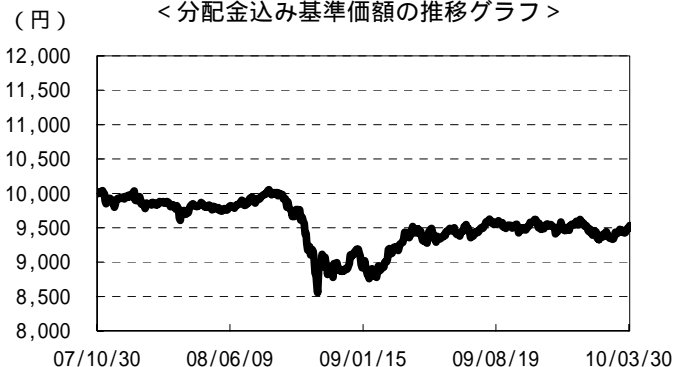
&lt; 分配金込み基準価額の推移グラフ &gt;

分配金込み基準価額は、分配金(税引前)を再投資したものと計算した理論上のものにご留意ください。基準価額は、信託報酬(年率0.7665%(税抜0.73%))控除後の値です。