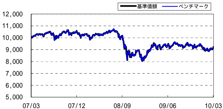
< マザーファンドの基準価額推移グラフ (過去3年間) >

ベンチマークはシティグループ世界国債インデックス(除く日本、ヘッジなし・円ベース)です。基準価額およびベンチマークは、2007年3月30日を10,000として指数化しています。シティグループ世界国債インデックスに関する著作権等の知的財産権その他一切の権利はシティグループ・グローバル・マーケット・インクに帰属します。