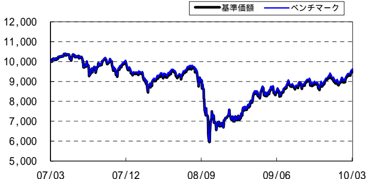
< マザーファンドの基準価額推移グラフ (過去3年間) >

ベンチマークはJ Pモルガン・エマージング・マーケット・ボンド・インデックス・プラス(ヘッジなし・円ベース)です。基準価額およびベンチマークは、2007年3月30日を10,000として指数化しています。J Pモルガン・エマージング・マーケット・ボンド・インデックス・プラスに関する著作権等の知的財産権その他一切の権利はJ Pモルガンに帰属します。