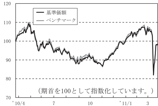
基準価額とベンチマーク(指数化)の推移