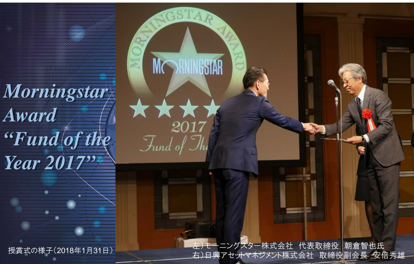
授賞式の様子(2018年1月31日)

当賞は国内追加型株式投資信託を選考対象として独自の定量分析、定性分析に基づき、2017年において各部門別に総合的に優秀であるとモーニングスターが判断したものです。国内株式大型 部門は、2017年12月末において当該部門に属するファンド623本の中から選考されました。