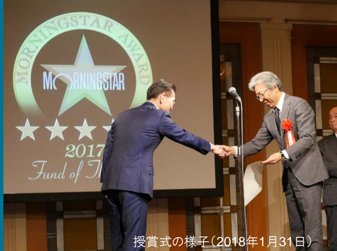
授賞式の様子(2018年1月31日)

当賞は国内追加型株式投資信託を選考対象として、モーニングスター独自の定量分析、定性分析に基づき、2017年において各部門別に総合的に優秀であるとモーニングスターが判断したものです。国際株式(グローバル)型 部門は、2017年12月末において当該部門に属するファンド 493本の中 から選考されました。