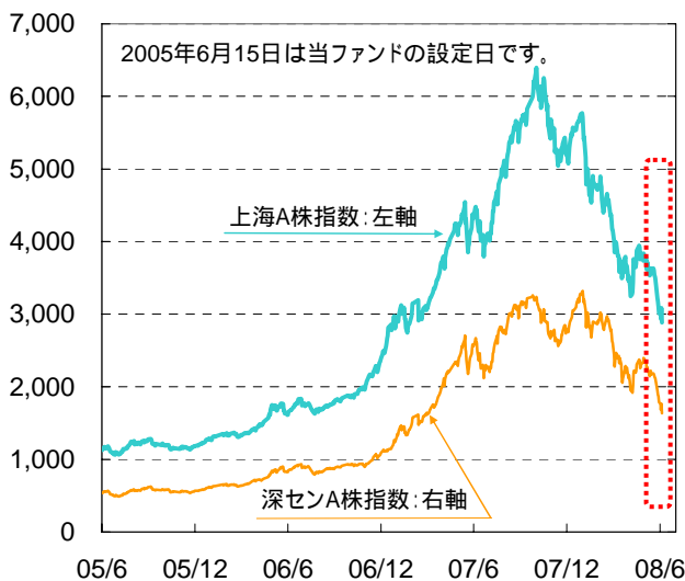
【中国A株指数の推移】(図 ) (2005年6月15日～2008年6月19日)