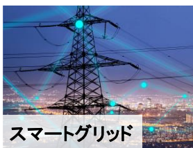
スマートグリッド