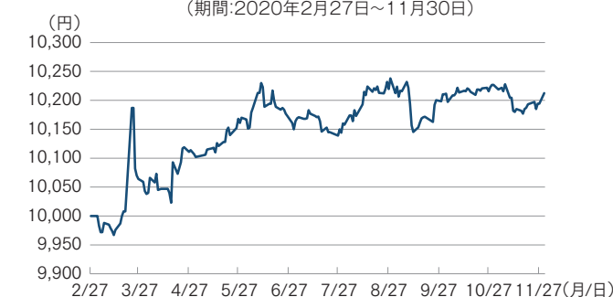
(ご参考)当戦略の代表ファンドの基準価額の推移 (期間:2020年2月27日~11月30日)

※当戦略の代表ファンドの設定来パフォーマンス。2020年2月27日~11月30日。上記騰落率は円ベースであり、運用報酬控除後、取引費用控除後、配当収入等再投資後のものを表示しています。上記は過去のものであり、将来の運用成果等を約束するものではありません。