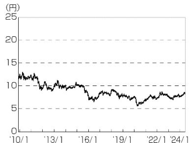
円／南アフリカランドの推移