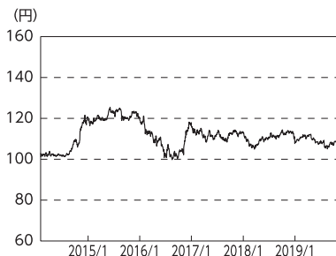
円／アメリカドルの推移