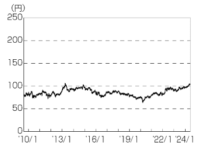
円／オーストラリアドルの推移