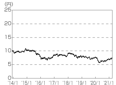
円／南アフリカランドの推移