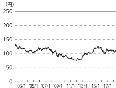
円／アメリカドルの推移