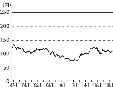
円／アメリカドルの推移