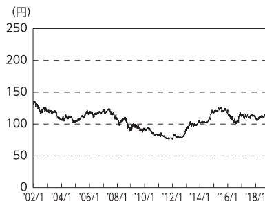
円／アメリカドルの推移