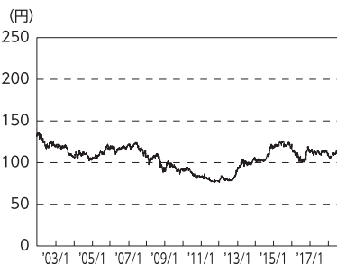
円／アメリカドルの推移