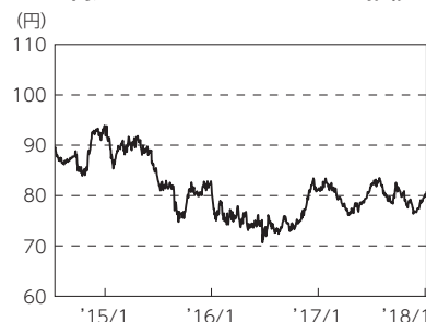
円／ニュージールランドドルの推移