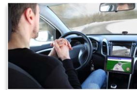
運転の自動(自律)化