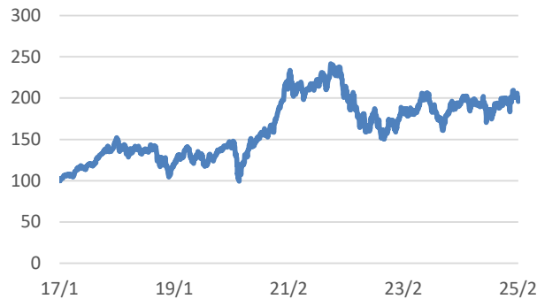
ROBO Global Robotics and Automation UCITS指数 (税引後配当込み、円ヘッジあり、円ベース)