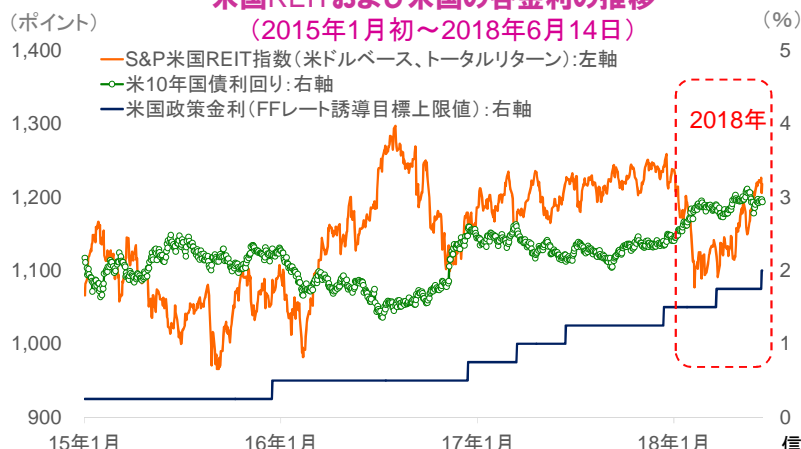
米国REITおよび米国の各金利の推移 (2015年1月初~2018年6月14日)