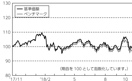
基準価額とベンチマーク（指数化）の推移