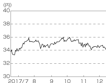
円／ブラジルリアルの推移