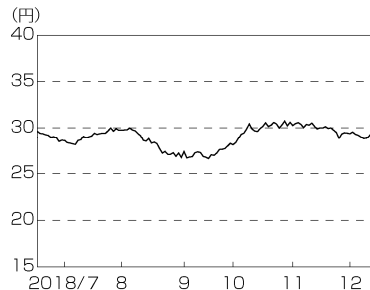
円／ブラジルリアルの推移