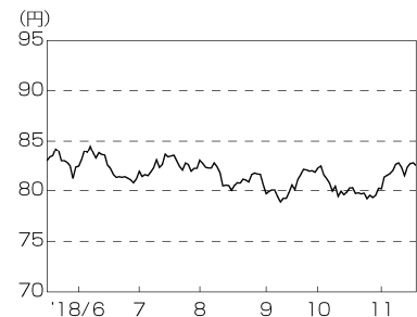
円／オーストラリアドルの推移