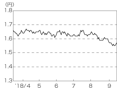
円／インドルピーの推移