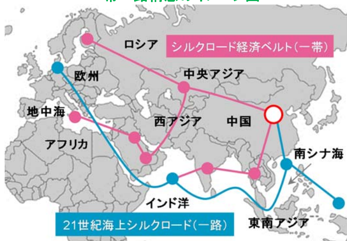
(中国国務院の情報をもとに日興アセットマネジメントが作成)

逆に言えば、約 14 億人を数える中国国民の一人当たり GDP が約 2.8 倍になるとすれば、世界に占める中国経済のシェアはとてつもなく大きいものとなる。それゆえ、実現不可能とささやかれても致し方ないが、中国の為政者としては、どのようにして実現させるかが、腕の見せ所となるはずだ。