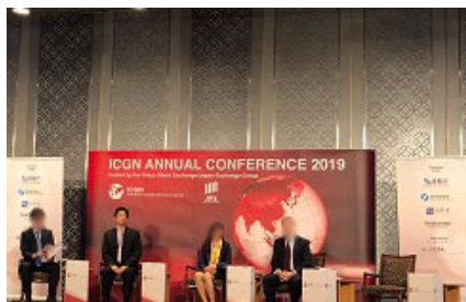
注: 左から2番目が筆者

投資家は企業からみて外部者であるから、経営の詳細を把握する力は限られる。しかし一方で、 機関投資家は「比較し選択する」ことの専門家だ。 企業と投資家は世界との比較に基づく対話をするのが望まれる。