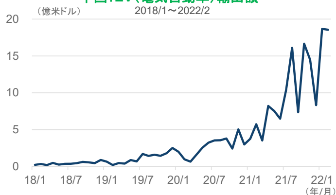
中国：EV(電気自動車)輸出額