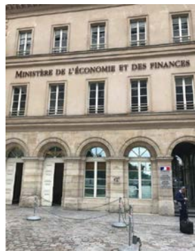
フランス政府・財政経済省

スペインでは、大手銀行による中堅銀行の救済合併が話題となっていた。株式・債券市場ともに、このことを好材料と受け止め、政策担当者も金融業界の過当競争が是正され、金融システムは健全化に向かうとして好感を持っていた。これまでも、中小金融機関の数を大幅に減らしており、業界再編は着実に進んでいる。このような改善を支えているの