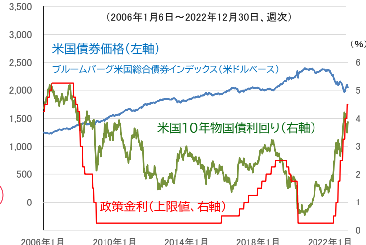
米国の債券と金利の推移

●信頼できると判断したデータをもとに日興アセットマネジメントが作成 ●上記は過去のものであり、将来を約束するものではありません。