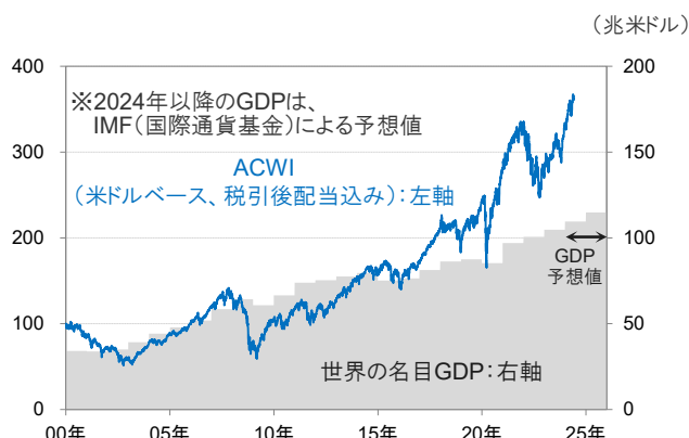
<【グラフ②】ACWIおよび世界のGDPの推移> (ACWI:2000年1月初~2024年5月末、GDP:2000年~2025年予想)