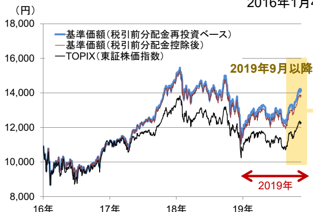
<ジパングのパフォーマンス> 2016年1月4日～2019年11月20日

10月末から11月中旬にかけては、7-9月期決算の説明会や個別取材を通じて、多くの経営者から話を聞く機会があります。その中で多くの経営者が口にしたのは、「地域別では中国と欧州が悪い」「セクターでは自動車関連が弱い」ということです。特に、日本企業の業績に影響を与えているのは、米中摩擦の問題などから中国国内で自動車関連を中心に設備投資が手控えられていることです。7-9月期決算では、中国向けの比率が高いFA（ファクトリーオートメーション）関連企業の業績見通しが下方修正されるケースが相次いだほか、素材関連や自動車部品関連においても厳しい業績となる企業が多く見られました。足元では、 「悪化が加速している状況にはないが、回復の兆しもまだ見られない」 とのコメントが多く聞かれました。